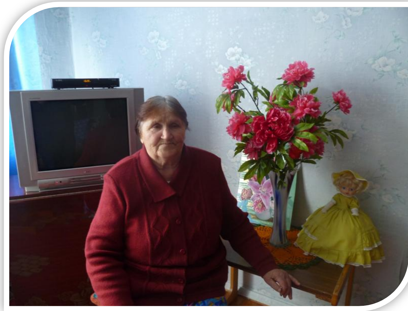
Мой день рождения